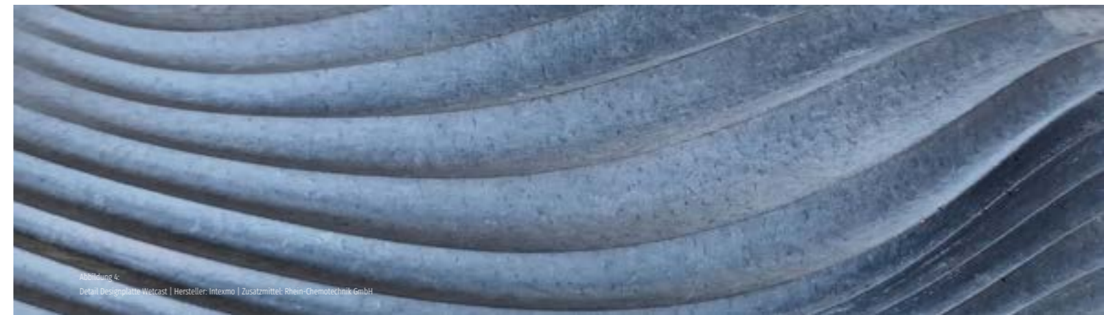
Abbildung 4: Detail Designplatte Wetcast | Hersteller: Intexmo | Zusatzmittel: Rhein-Chemotechnik GmbH

Beim Wetcast-Verfahren trocknet der Beton in der Form. Dieser Umstand ist beim Herstellungsprozess zu beachten. Anders als beim Pressbeton stehen die Formen im Produktionsablauf nicht direkt wieder zur Verfügung und müssen deshalb in ausreichender Menge vorgehalten werden. Die höheren Investitionskosten für die Musterherstellung, die Menge der benötigten Formen und die längeren Trocknungszeiten schlagen sich auf die Verbraucherpreise für Wetcast-Steine nieder. Darüber hinaus ist auch der Herstellungsprozess durch den höheren Anteil an Handarbeit zeit- und kostenintensiv.